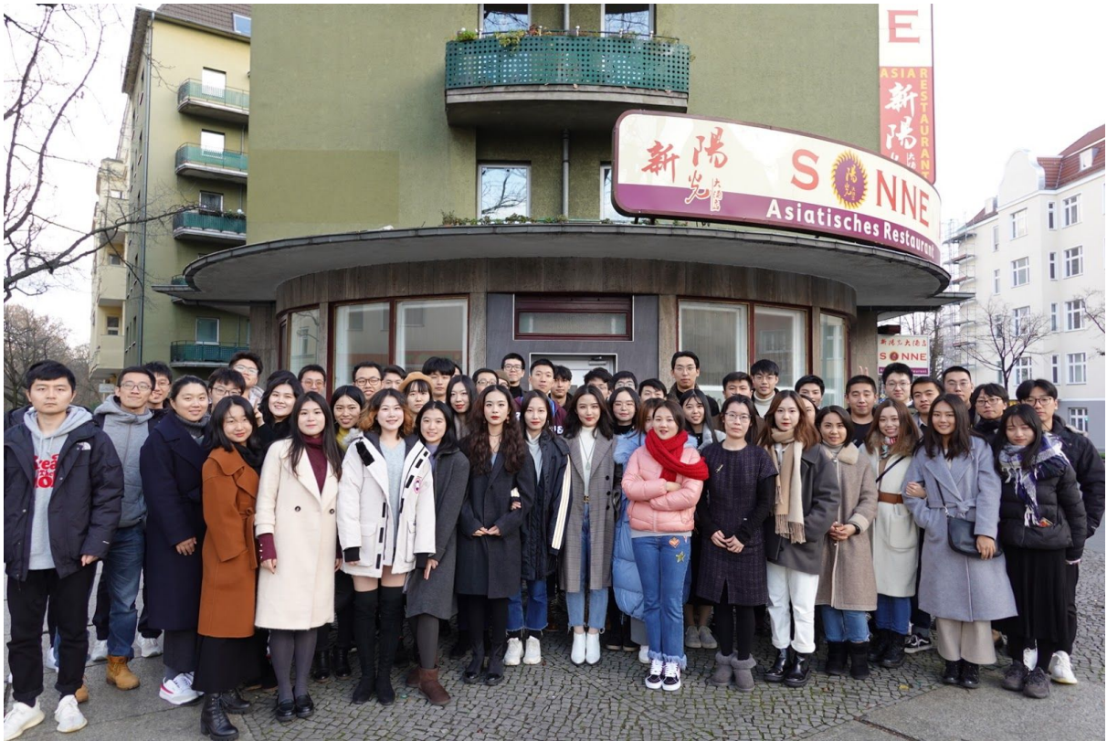
(柏林工业大学学生学者联合会 TUB-GCA)